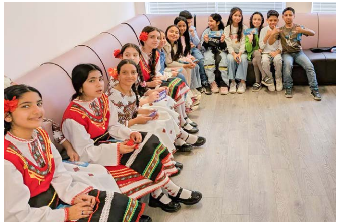
Jugendliche aus Maglizh, die am Projekt ‚Neue Wege zur sozio-ökonomischen Integration junger Romnja und Roma im Donauraum‘ teilnehmen, hier in einer Tanzgruppe (Seite 7).

Ulrich Kuhn Freundeskreis des Bulgarisch-Deutschen Sozialwerks e.V.